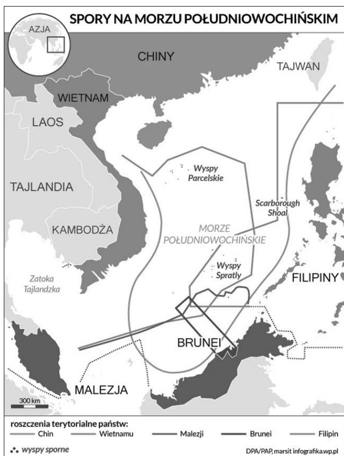
Rysunek 2. Sporne obszary na Morzu Południowochińskim

Spory terytorialne dotyczą przede wszystkim dwóch archipelagów: Wysp Parcelskich – archipelag złożony z około 15 wysp, w konflikt zaangażowane są Chiny i Wietnam; Wysp Spratly, na które składa się około 170 wysp, w konflikt zaangażowane są Chiny, Wietnam, Tajwan, Malezja oraz Brunei. Położenie geograficzne spornych terenów przedstawiono na rysunku 2.