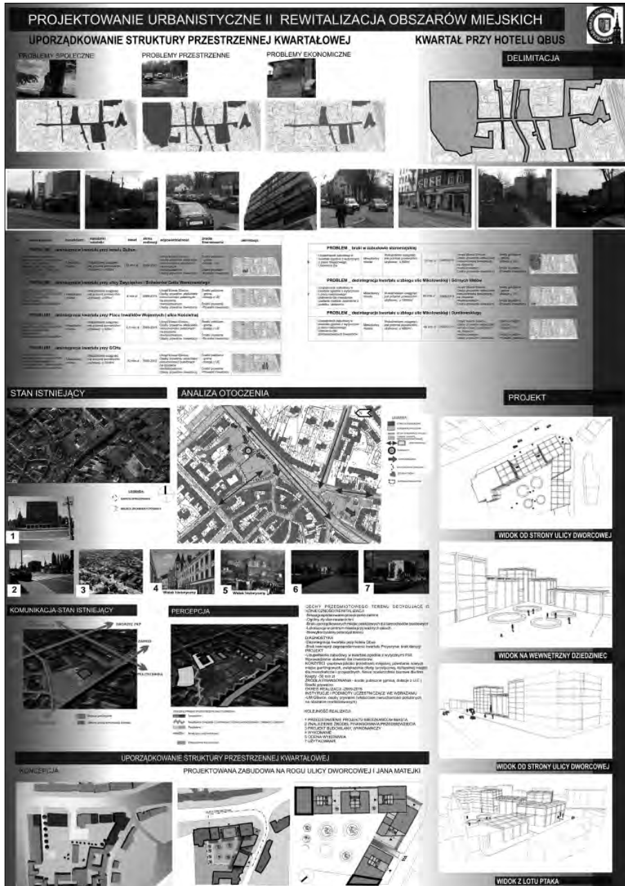
Rysunek 5. Poster prezentujący opracowany przez studenta program rewitalizacji urbanistycznej oraz wybrany projekt rewitalizacji urbanistycznej

Źródło: Wydział Architektury Politechniki Śląskiej, Katedra Urbanistyki i Planowania Przestrzennego. Projekt rewitalizacji i rewitalizacji urbanistycznej centrum Gliwic, autor: Jakub Hendzel.