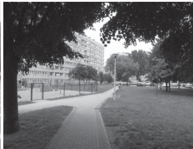
Il. 3. Fragment berlińskiego modernistycznego założenia Karl-Marx-Allee II (który został zamieniony częściowo na parking), z widokiem na socrealistyczną zabudowę Karl-Marx-Allee I (stan 2016 r.). / A fragment of modernist establishment Karl-Marx-Allee II in Berlin (which was turned partly into parking space), with a view of social realist buildings Karl-Marx-Allee I (as of 2016.).