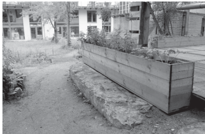
Il. 8. Wnętrze rekreacyjne berlińskiego zespołu przy Joachim-Karnatz-Allee od strony Sprewy (stan 2016 r.). Źródło: materiały własne autora / Recreational interior of the Berlin complex at Joachim-Karnatz-Allee from the Spree side (as of 2016). Source: author's own materials