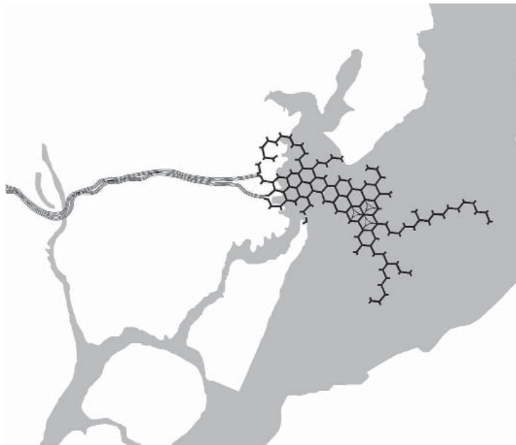
il. 6. Schemat ideowy Pływającego miasta (Floating City) autorstwa Kisho Kurokawy. / Schematic diagram of the Floating City by Kisho Kurokawa.

lucji komponowania terenów rekreacyjnych zespołów mieszkaniowych. Jako cechy charakterystyczne, wyróżniające te realizacje, odnotować należy ich strukturalny (najczęściej pasmowy) sposób komponowania, skalę oraz przede wszystkim – dążenie do wykorzystania naturalnego (lub imitującego naturalne) środowiska przyrodniczego. Odróżniało to zasadniczo kreowany przez architektów wczesnego modernizmu geometryczny układ terenów rekreacyjnych od założeń, które miały dążyć do integracji z możliwie dziewiczą (lub imitującą dziewiczość) naturą.