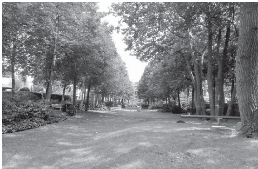
il. 7. Rekreacyjne wnętrze kwartału przy Rauchstraße w Berlinie według projektu Roba Kriera (stan 2016 r.). Źródło: materiały własne autora / Recreational interior of quarter at Rauchstraße in Berlin, designed by Rob Krier (as of 2016). Source: author's own materials