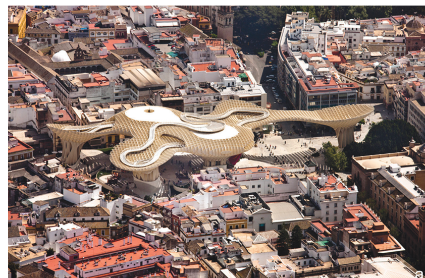
Il. 2. a, b – Sewilla, nowe wnętrza urbanistyczne i podziały istniejącego wnętrza utworzone przez podpory ogromnych „parasoli” / a, b – Seville, – new partitions of urban interiors are created by the columns supporting giant “umbrellas”

One of the most spectacular examples of an autonomous architectural form the superior function of which is providing shade is located in Seville, in the very heart of the Old Town, on a square which for decades served as a municipal car park. This controversial project designed by Berlin-based architect, Jürgen Mayer, completed in 2011, made a significant – and most probably irretrievable – effect on the shape of La Encarnación square, becoming a contemporary icon of the city. Six colossal, wooden umbrellas combined in one biomorphous structure fill the space of the piazza and create an openwork roofing over it, providing the