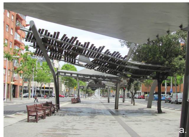
Il. 4. a – charakterystyczne pergole w ciągu Av. D'Icària w Barcelonie, b – wachlarze pojawiające się w przestrzeniach publicznych dzielnicy Nou Barris stanowią część strategii umacniania lokalnej tożsamości, c – czekający na realizację zwycięski projekt konkursowy „Canopia Urbana” przekształcający przestrzeń niegdysiejszego skrzyżowania Plaça de les Glòries Catalanes, d – Zadaszenie nad targowiskiem Els Encants / a – Characteristic pergolas on Av. D'Icària in Barcelona, b – Shading structures in the form of fans that are present in the public spaces of Nou Barris district became part of the strategy for reinforcing local identity, c – The winning project of “Canopia Urbana” transforming the area of former junction Plaça de les Glòries Catalanes, d – The roof over the Els Encants marketplace