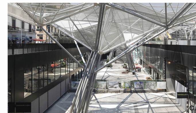
Il. 1. a – zadaszenie Via Santa Radegonda w Mediolanie, b, c – ażurowy dach nad Piazza Garibaldi w Neapolu wydzielający nową przestrzeń w ramach większego placu / a – The roof over Via Santa Radegonda in Milan, b, c – Transparent roof structure over Piazza Garibaldi in Naples creating the limits of new space within the existing square

wycięciu poniżej poziomu terenu mieszczą się m.in. wejścia na stacje metra i kolei, a także spora galeria handlowa. Ażurowa, swobodna struktura wypełniona jest płytami perforowanej blachy i tekstylnymi panelami w różnym stopniu przepuszczającymi promienie słoneczne. Przekrycie w sposób bardzo czytelny tworzy dodatkową, autonomiczną przestrzeń, substytut wnętrza budynku pozwalając równocześnie na zachowanie kontaktu ze światem zewnętrznym. Dach rozciągając się również na poziomie terenu wyznacza umowny zasięg oddziaływania znajdującego się poniżej węzła transportowego; pozostała przestrzeń jest zagospodarowywana jako plac miejski o charakterze rekreacyjnym z dużym udziałem terenów zielonych.