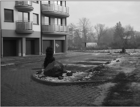
Fot. 5. Aranżacja zieleni – tuja i kamień, zabudowa wielorodzinna, Ruczaj, ul. Drukarska, Kraków Photo. 5. Green „composition” – shrub/tree and stone, housing estate, Ruczaj, Kraków