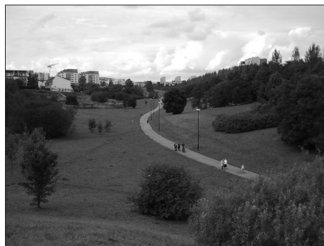
Fot. 2. Park Rury, wtopiony w zabudowę wielorodzinna dzielnic LSM i Rury, Lublin Photo. 2. Rury Park between housing estates of LSM and Rury, Lublin