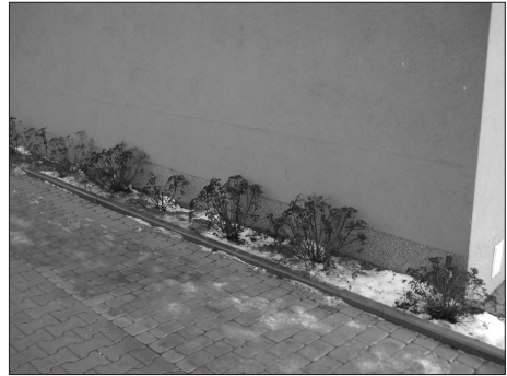
Fot. 6. Rachityczna zieleni – przy ścianie budynku – zabudowa przy ul. Drukarskiej, Ruczaj, Kraków Photo. 6. Shrubs alongside building wall – block of flats next Drukarska Street, Ruczaj, Kraków