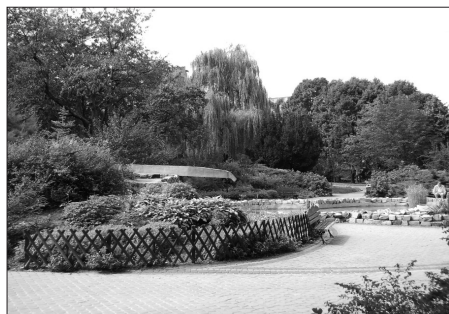
Fot. 7. Skwer w os. Piastowskim, LSM, Lublin

Photo. 7. Piastowskie housing estate – small park, LSM, Lublin