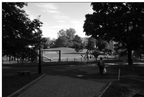
Fot. 8. Zielona przestrzeń rekreacyjna w os. Słowackiego, LSM, Lublin

Photo. 7. Piastowskie housing estate – small park, LSM, Lublin