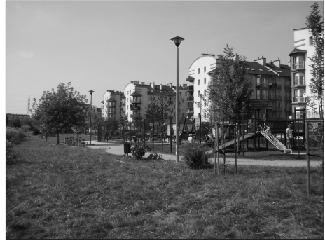
Fot. 4. Zieleni z urządzeniami do zabaw dla dzieci na obrzeżu os. Żabiniec, Kraków Photo. 4. Park with place for children, on the border of Żabiniec housing estate, Kraków