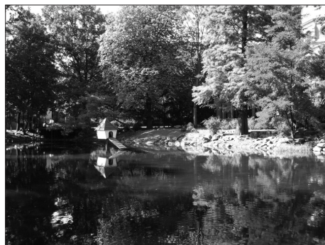
Fot. 1. Zieleni i woda. Park im. Kazimierza Wielkiego, Bydgoszcz Photo. 1. Green and water. Kazimierz Wielki Park, Bydgoszcz

Dla zobrazowania jakości tej zieleni, zwłaszcza tzw. zieleni osiedlowej, przytoczono kilka przykładów z polskich miast. W odniesieniu do współczesnych trendów w kształtowaniu zabudowy mieszkaniowej wielorodzinnej za ilustrację mogą posłużyć