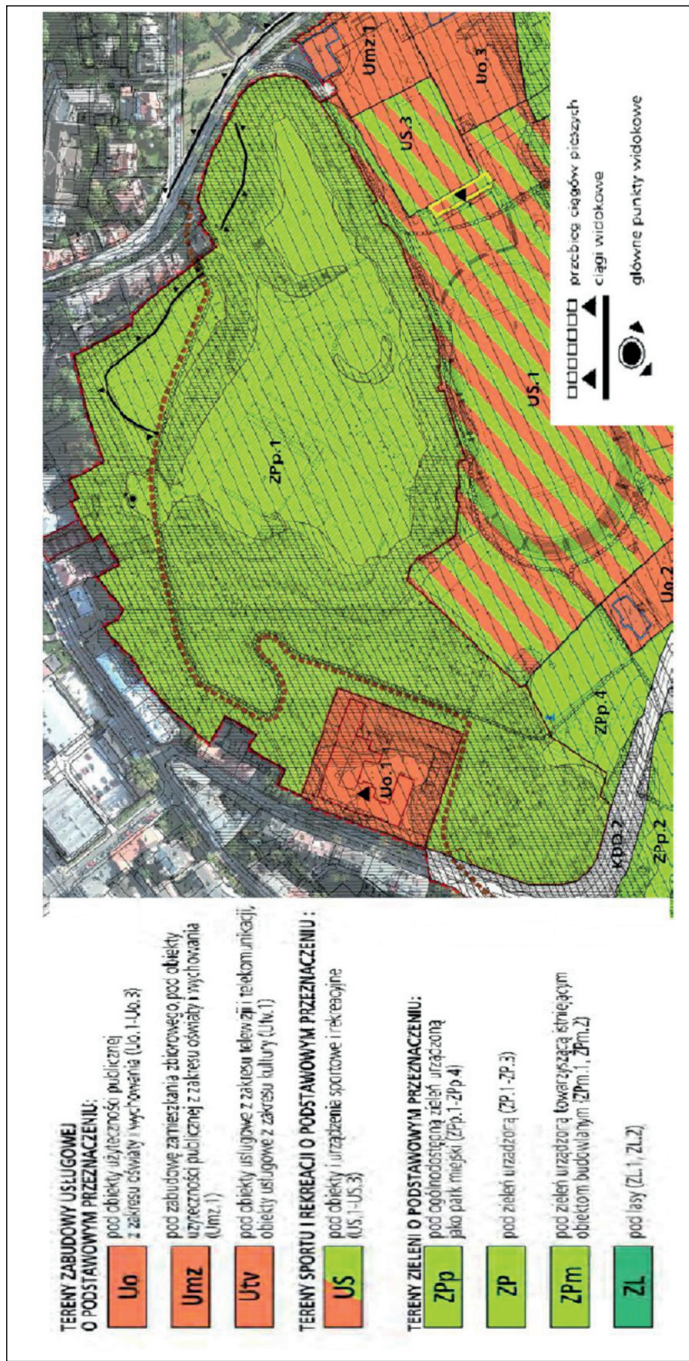
Ryc. 1. Fragment planu miejscowego Stare Podgórze-Krzemionki w Krakowie – teren ZPp.1 – Park Bednarskiego Fig. 1. Part of Stare Podgórze-Krzemionki local plan in Krakow, ZPp.1 zone, Bednarski Park