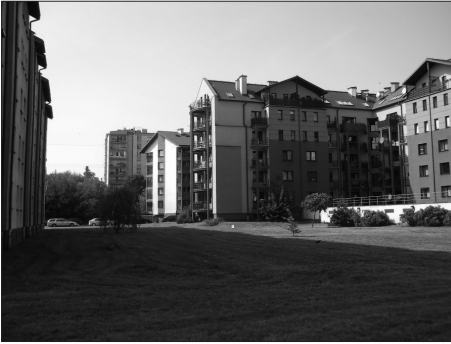
Fot. 3. Zieleni o funkcji głównie estetycznej, os. Żabiniec, Kraków Photo. 3. Esthetic function of green areas, Żabiniec housing estate, Kraków