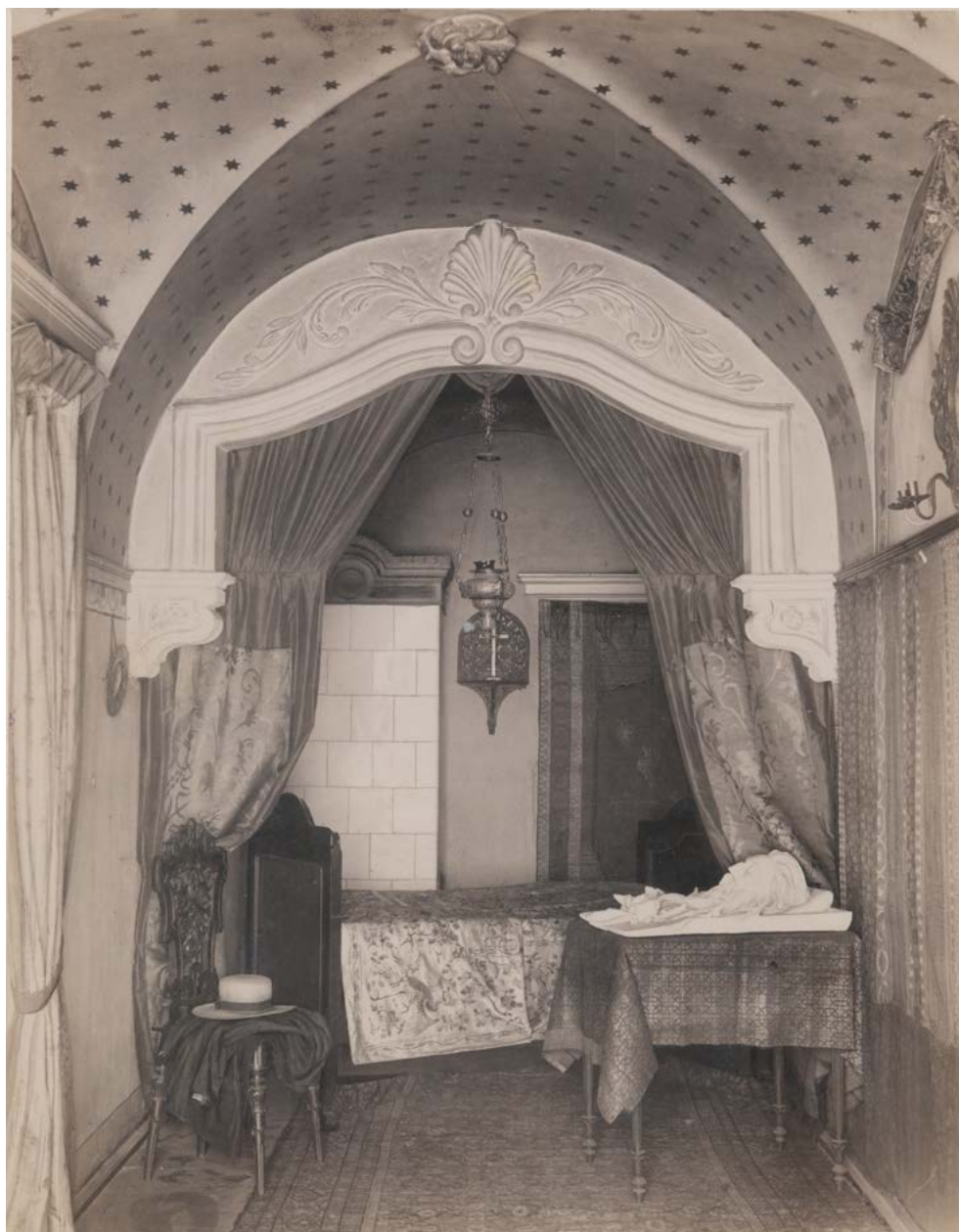
Il. 10. Sypialnia w Domu Jana Matejki przy ul. Floriańskiej 41, fot. Juliusz Mien, ok. 1896 r. ANK, Zbiór fotograficzny, sygn. 29/670/8648 (sygn. dawna A V 602)