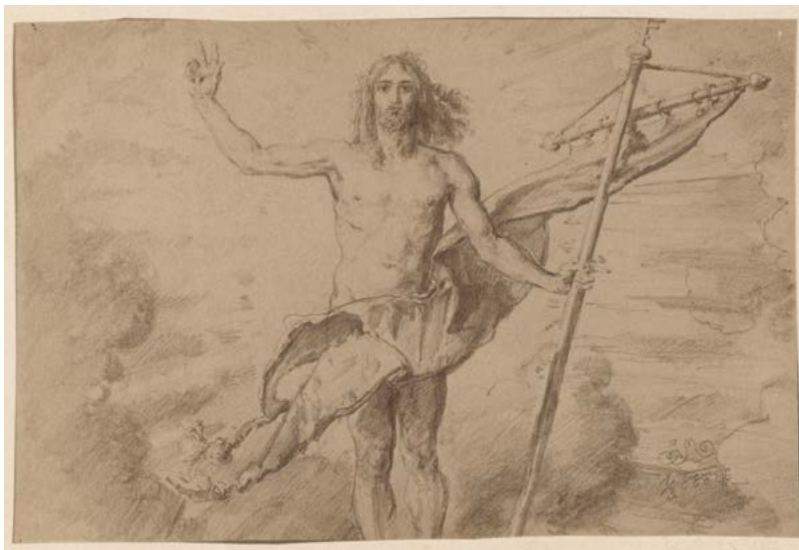
Il. 9. Szkic rysunkowy Jana Matejki do ikonostasu w kościele grecko-katolickim p.w. św. Norberta w Krakowie – Chrystus Zmartwychwstały , b.a. fot., ok. 1888 r. ANK, Zbiór fotograficzny, sygn. 29/670/4135 (sygn. dawna A III 933)