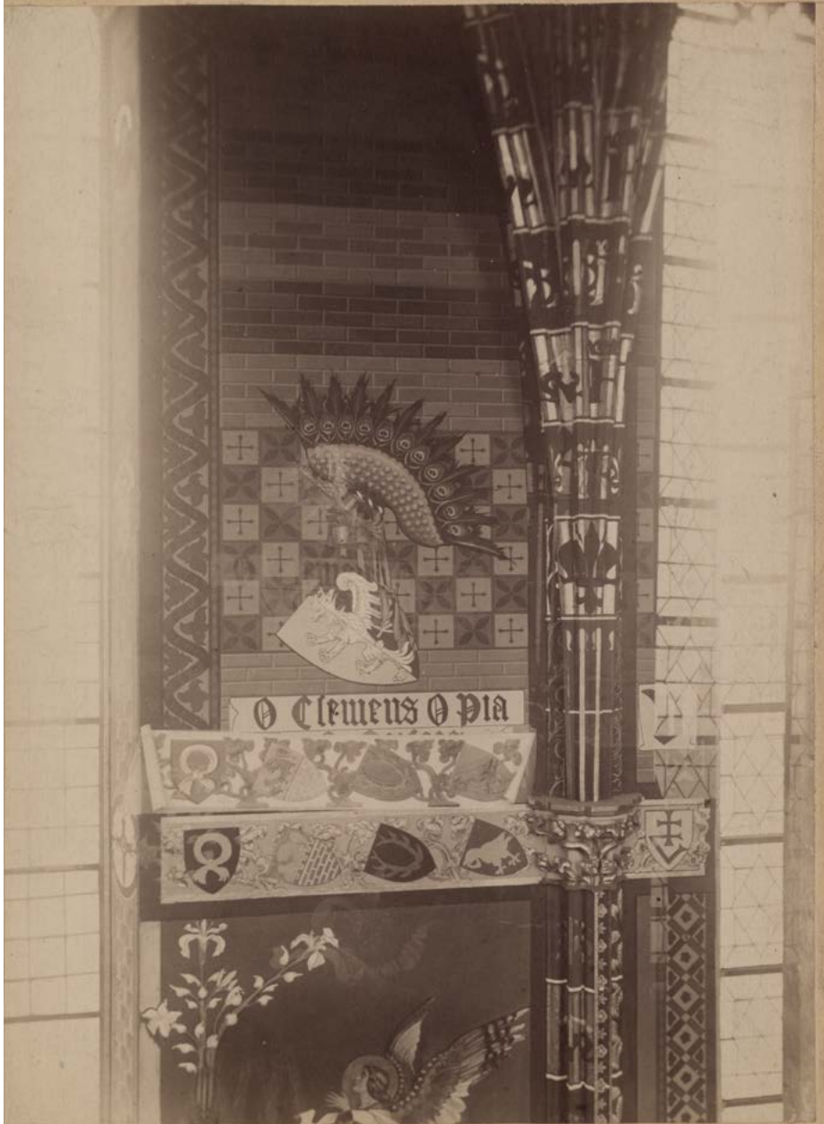
Il. 4. Wnętrze prezbiterium kościoła Mariackiego podczas restauracji. Prace przy polichromii wg projektu Jana Matejki (fragment północnej ściany: pierwszego przęsła od wschodu), [Zakład artystyczno-fotograficzny Juliusza Mięna w Krakowie, zdjęmował Jerzy Głogowski], ok. 1889 r. ANK, Zbiór fotograficzny, sygn. 29/670/9408 (sygn. dawna A V 1263)