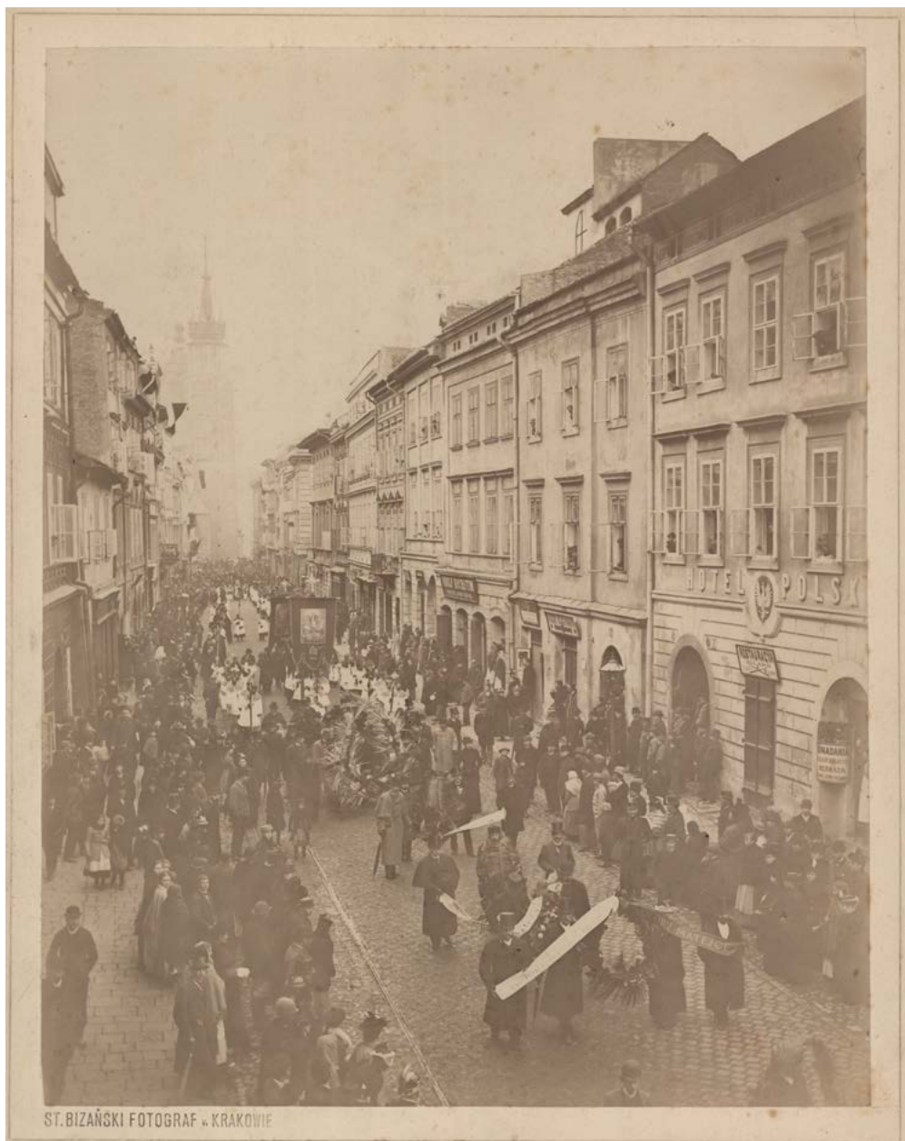
II. 3. Kondukt pogrzebowy na ul. Floriańskiej, w drodze na cmentarz Rakowicki. Delegacje z wieńcami, fot. Stanisław Bizański, 7 listopada 1893 r. ANK, Zbiór fotograficzny, sygn. 29/670/8875 (sygn. dawna A V 810)