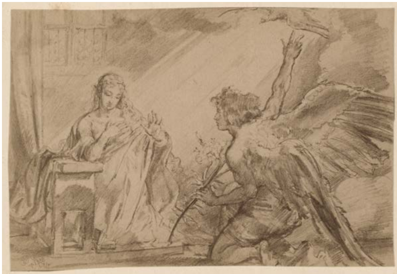
Il. 8. Szkic rysunkowy Jana Matejki do ikonostasu w kościele grecko-katolickim p.w. św. Norberta w Krakowie – Zwiastowanie , ok. 1888 r. sygn. 29/670/4133 (sygn. dawna A III 931)