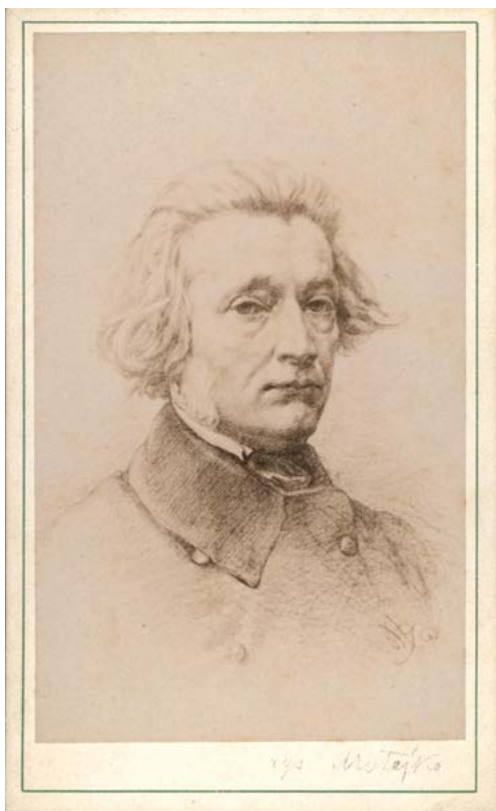
Il. 7. Rysunek Portret Adama Mickiewicza, ok. 1875 r.