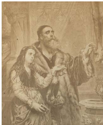
Il. 6. Obraz Ociemniały Wit Stwosz z wnuczką , [fot. Walery Rzewuski?], ok. 1865 r. ANK, Zbiór Ambrożego Grabowskiego, sygn. 29/679/47 (sygn. dawna E 56), ryc. 148