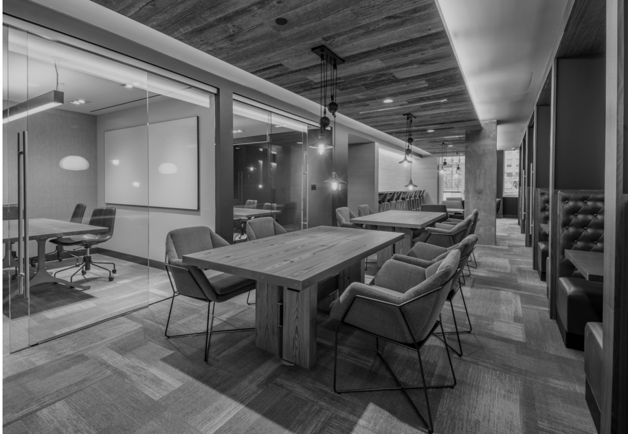
Il. 4. Pierwszy segment strefy Homework