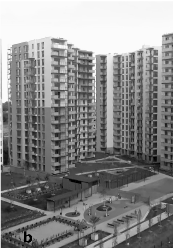
II.1. a) Plan sytuacyjny Osiedla Nowa Letnica w Gdańsku, b) widok na budynki G1 i G2