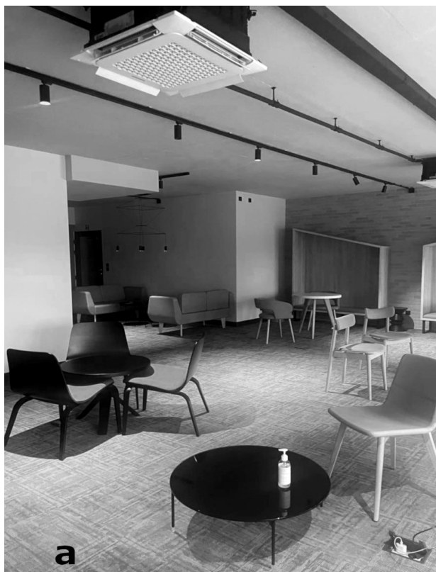
III. 2. a) The interior of the co-working space in the G1 building, photo by Natalia Kuroпка, b) the conference room, photo by Natalia Kuroпка