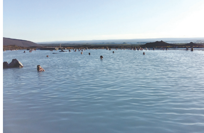
II. 6. Widok głównego zbiornika Mývatn Nature Baths. Na dalekim planie widoczne wody jeziora Mývatn objętego ochroną. III. 6. View of the main pool of Mývatn Nature Baths. In the background one can see the waters of Lake Mývatn, which is under protection.

turalnej scenerii, służącymi przede wszystkim relaksowi. To, oraz wysoka opłata za wstęp odróżnia je od opisanych wcześniej basenów o charakterze sportowo-rekreacyjnym 20 . Podobnie jak w przypadku Błękitnej Laguny, założenie i funkcjonowanie Mývatn Nature Baths są ściśle związane z działającą w pobliżu elektrownią geotermalną. W obu przypadkach gorąca woda z odwiertów zasilających elektrownie, po oddaniu w turbinach części energii cieplnej jest kierowana do wymiennika ciepła podgrzewającego wodę w kąpielisku.