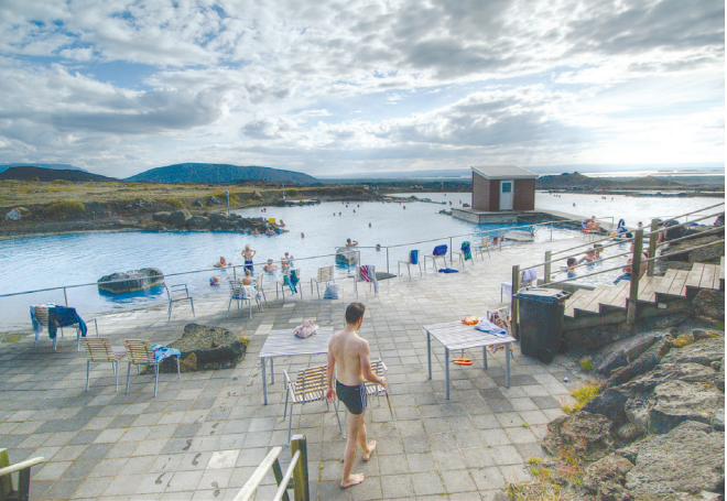
II. 5. Widok ogólny kąpieliska Mývatn Nature Baths z sylwetką krateru Hverfjall na horyzoncie. III. 5. General view of the Mývatn Nature Baths complex with the outline of Hverfjall crater on the horizon.