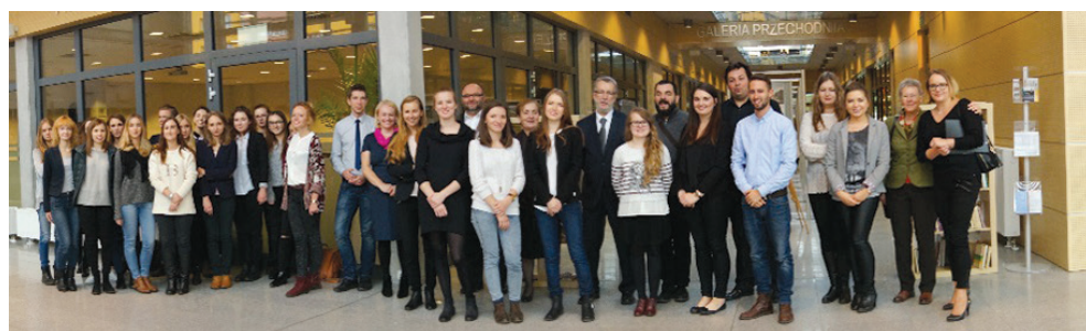
II. 10. Wystawa prac studenckich. Biblioteka w Oświęcimiu. Zdjęcie zespołowe: studenci II roku, dyplomanci WA PK