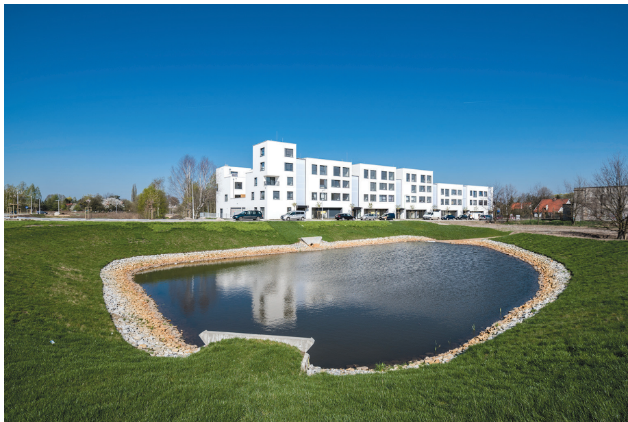
II. 7. Nowe Żerniki – zbiornik wód deszczowych

III. 6. Nowe Żerniki – axonometry of settlement