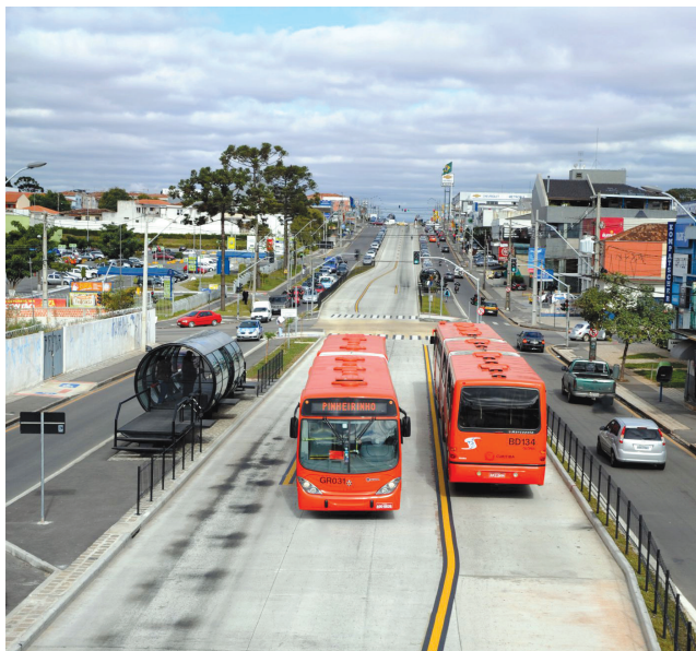
II. 2. Kurytyba – system lin autobusowych i przystanków III. 2. Curitiba – bus line and bus stops system