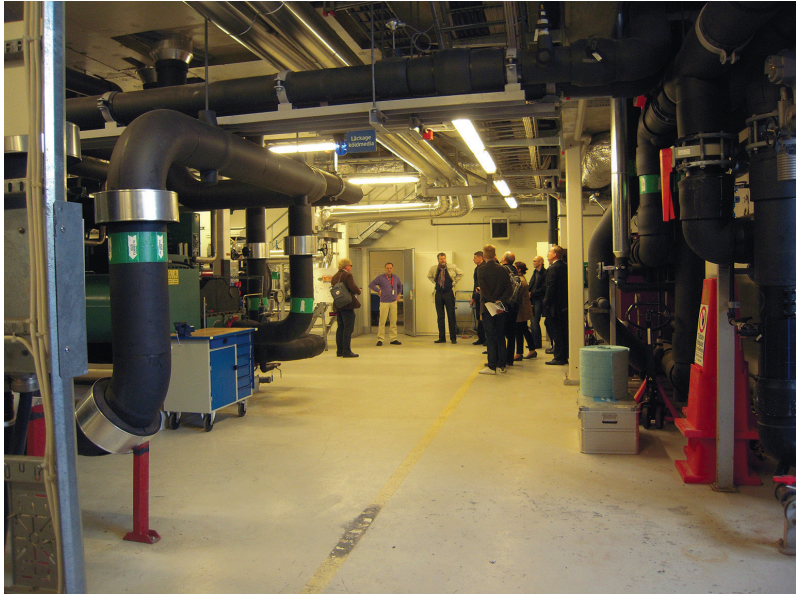
II. 4. Bo01 – Urządzenia pomp ciepła III. 4. Bo01 – Heating pump equipment