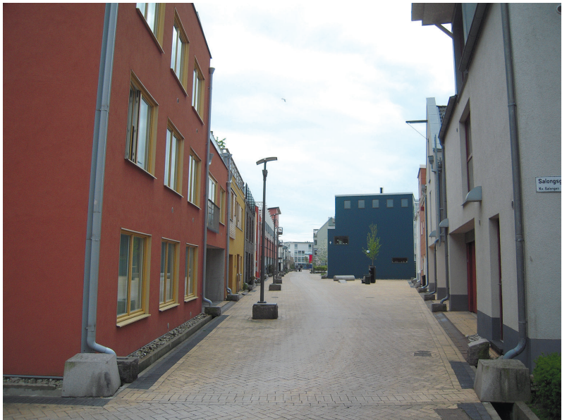
II. 5. Bo01 – Kanały wód deszczowych wzdłuż dróg III. 5. Bo01 – Rainwater canals along the roads