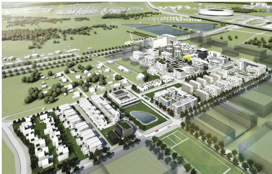
II. 6. Nowe Żerniki – aksonometria osiedla (źródło: http://nowezerniki.pl/realizacje )

III. 6. Nowe Żerniki – axonometry of settlement