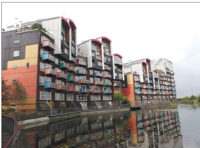
II. 3. Greenwich Millenium Village – zarządzanie wodą deszczową III. 3. Greenwich Millenium Village – water management