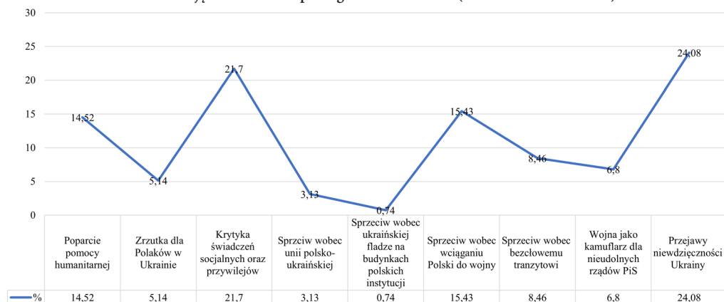
Wykres 2. Kategorie materiałów na temat wojny w Ukrainie opublikowanych przez Konfederację Wolność i Niepodległość na Twitterze (24.02.2022–13.02.2023)

Źródło: opracowanie na podstawie własnych badań