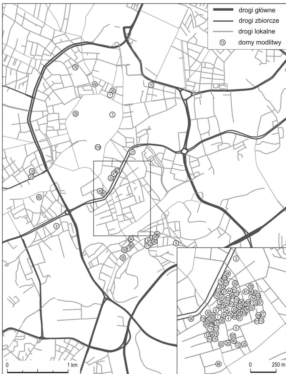
Ryc. 1. Obszar Gminy Wyznaniowej Żydowskiej w Krakowie ustanowiony w 1939 r.