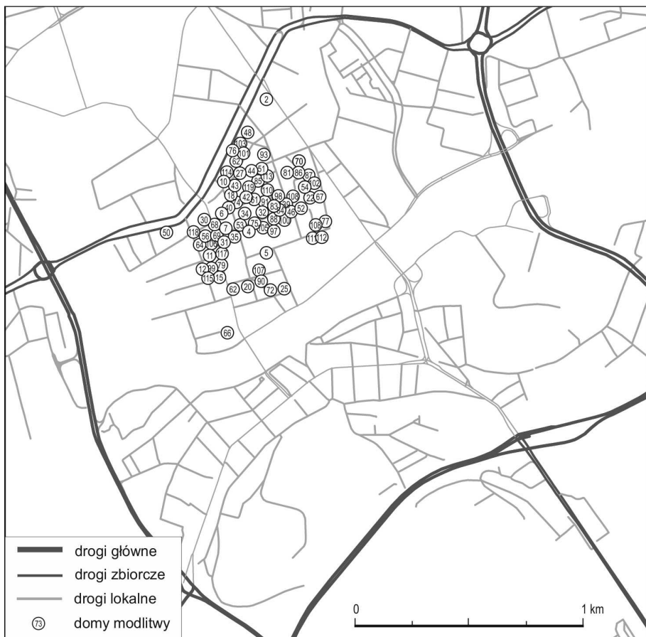
Ryc. 3. Rozmieszczenie żydowskich domów modlitwy w Krakowie w latach 1918–1939

Najwięcej domów modlitwy, bo ok. stu, znajdowało się na terenie obecnej dzielnicy Podgórze (na Kazimierzu). Natomiast pozostałe zlokalizowane były w granicach obecnego Starego Miasta, Grzegórzek oraz Dębnik. Obiekty modlitewne poza Kazimierzem były głównie prywatnymi budynkami, w których wydzielano np. część kamienicy na spotkania w celu wspólnej modlitwy. Często też w jednej kamienicy funkcjonowało kilka domów modlitwy (Piech 1999).