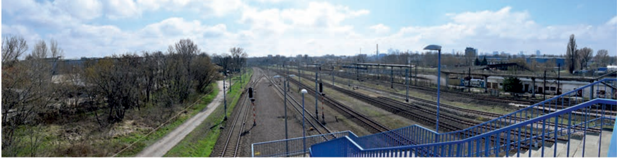
Fot 1. Widok torowiska z kładki na stacji Warszawa Praga w kierunku południowym. Na horyzoncie widoczne sylwetki wieżowców „warszawskie city” po drugiej stronie rzeki Wisły. Photo 1. A view of the track from the footbridge at the Warszawa Praga station to the south. On the horizon, you can see the silhouettes of the “Warsaw City” skyscrapers on the other side of the Vistula River.