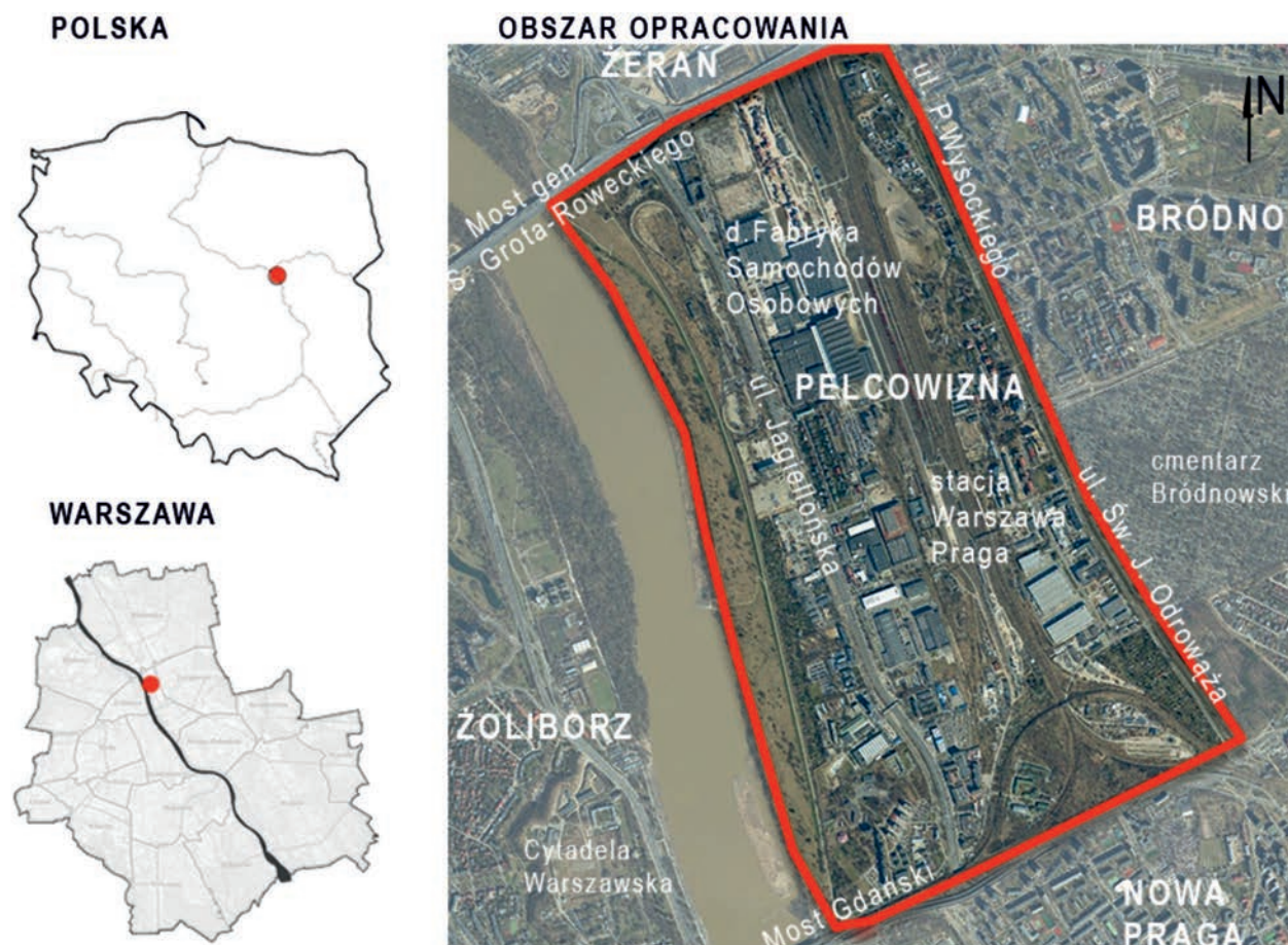
il. 1. Lokalizacja omawianego obszaru / Location of the area in question

Economy transformations in the beginning of the 21st century towards a creation of a global network of production, trade, service and transport connections, and especially acceleration of development of digital technologies and process automation, result in the transfer of existing production plants outside the central areas of agglomerations, and frequently to other regions of the world. According to economic sciences, post-industrial areas can be included in the cost that arises as a result of adapting production activities to the changing economic situation cycles and the elimination of enterprises that unfavorably located in the world, countries, regions and cities (Huculak, 2009, p. 139). Urban areas designated for production and service functions, often of key importance – as in the case of Warsaw in shaping of the spatial structure until 1990 – began to lose their importance and are undergoing gradual degradation. At the same time, due to their location, they constitute an exceptionally valuable resource for the city (Grochowski, Bogiel, 2014, p. 65) making them attractive for the introduction of new functions: services and housing (Gasidło, 2013). These transformations, in turn, can contribute to the development of the system of urban public areas with new, valuable systems (Brzosko-Sermak,