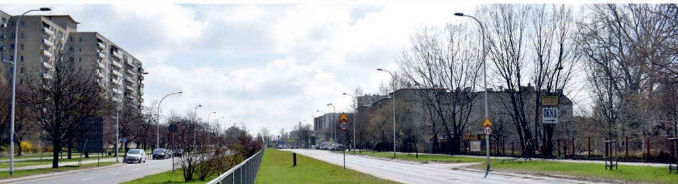
Fot. 3. Okolice ulic: Św. J. Odrowąża / P. Wysockiego – przy wschodniej granicy obszaru opracowania, a także ulic: Staniewickiej / Pożarowej w głębi omawianego terenu. Fot. M. Duda 2021 Photo 3. The vicinity of the streets: Św. J. Odrowąża and P. Wysockiego – at the eastern border of the study area, as well as Staniewicka and Prożowa streets in the depths of the area in question. Photo M. Duda 2021