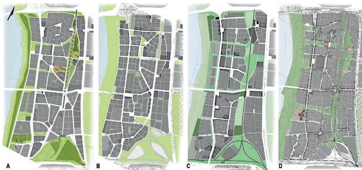
il. 3. Zestawienie czterech studialnych wariantów koncepcji zagospodarowania przestrzennego Pelcowizny (oprac. własne na podst. prac zespołów: A, B, C i D)

ill. 3. A set of four study variants of the concept of Pelcowizna area development, (worked on the plans designed by teams: A, B, C, D)