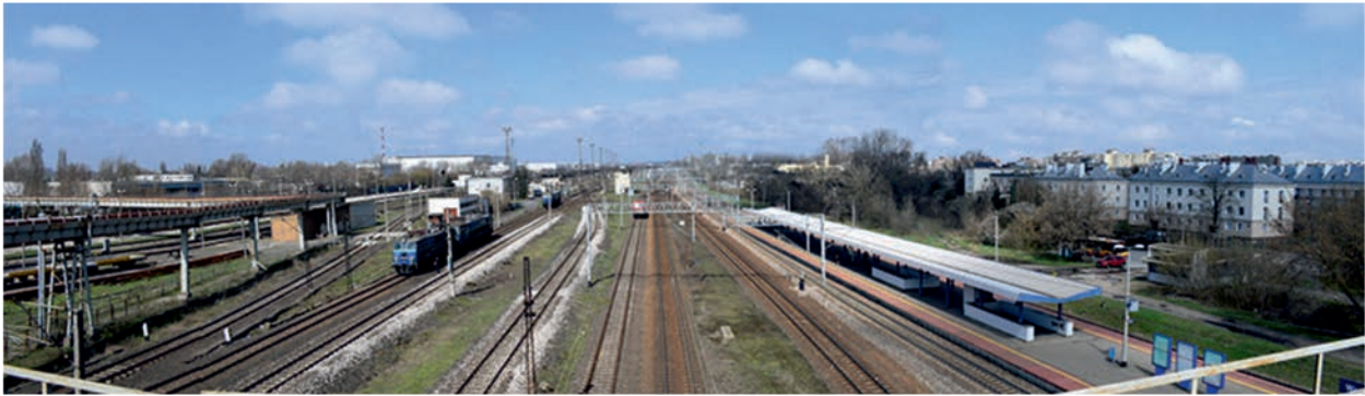
Fot 2. Obszar opracowania widziany z kładki na stacji Warszawa Praga w kierunku północnym. W oddali, po lewej stronie zdjęcia – komin Elektrociepłowni Żerań. Na prawo – domy wielorodzinne przy ul. Pożarowej i Oliwskiej. Photo 2 The study area as seen from the footbridge at the Warszawa Praga station to the north. In the distance, on the left side of the photo – the chimney of the Żerań Heat and Power Plant. To the right – multi-family houses at Pożarowa and Oliwska streets.

ki urbanistycznej, a niekoniecznie całej gminy, pozwalając w wiążący sposób koordynować plany miejscowe (il.1). Funkcję taką mógłby pełnić plan ogólny, wprowadzony w polski system planistyczny przepisami prawa budowlanego w 1928 r. (Rozp., 1928) jako opracowanie sporządzane dla całego osiedla (za osiedle uznawano m.in. miasta i miasteczka) lub jego części.