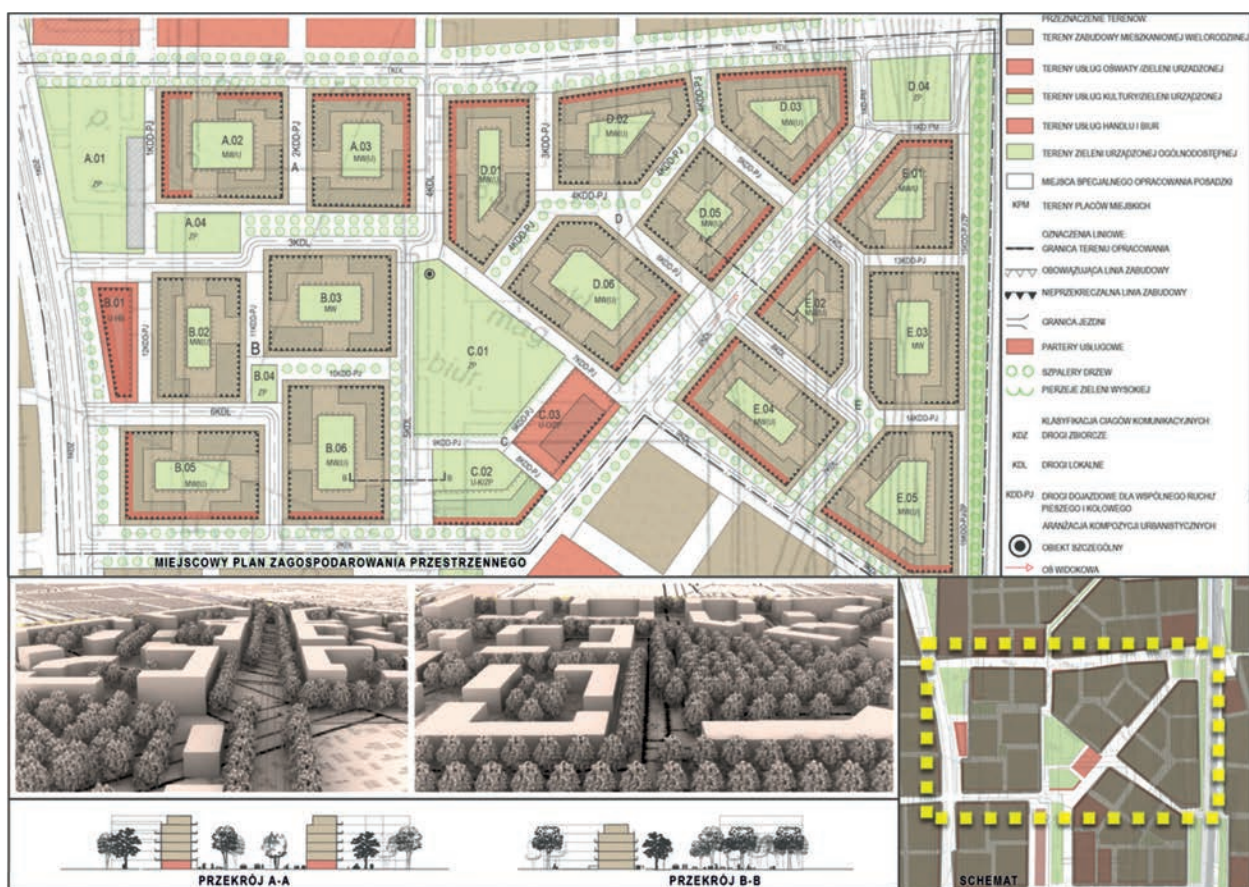
il. 4. Fragment obszaru opracowany w konwencji miejscowego planu zagospodarowania przestrzennego. (autor: stud. Emilia Czajka) ill. 4 Fragment of the area developed in the convention of the local spatial development plan, (author: stud. Emilia Czajka)

Zestawienie wariantowych rozwiązań planu ogólnego pokazuje, że aby zrealizować powyższe kryteria dla całej większej jednostki urbanistycznej - przed opracowaniem fragmentów w formule miejscowego planu zagospodarowania przestrzennego – niezbędne jest określenie podstawowych składników struktury przestrzennej i rodzaju założeń projektowych. Tym samym została potwierdzona konieczność opracowania całościowej koncepcji dla „większej jednostki urbanistycznej” koordynującej bardziej szczegółowe rozwiązania zawarte w projektach planu miejscowego. Określenie położenia zabudowy i sprawdzenia przy pomocy budynków trafności podjętych decyzji projektowych, jest dopiero możliwe w skali odpowiedniej dla planu szczegółowego. Ten sposób postępowania pokazuje zamieszczony powyżej przykład (il. 4).