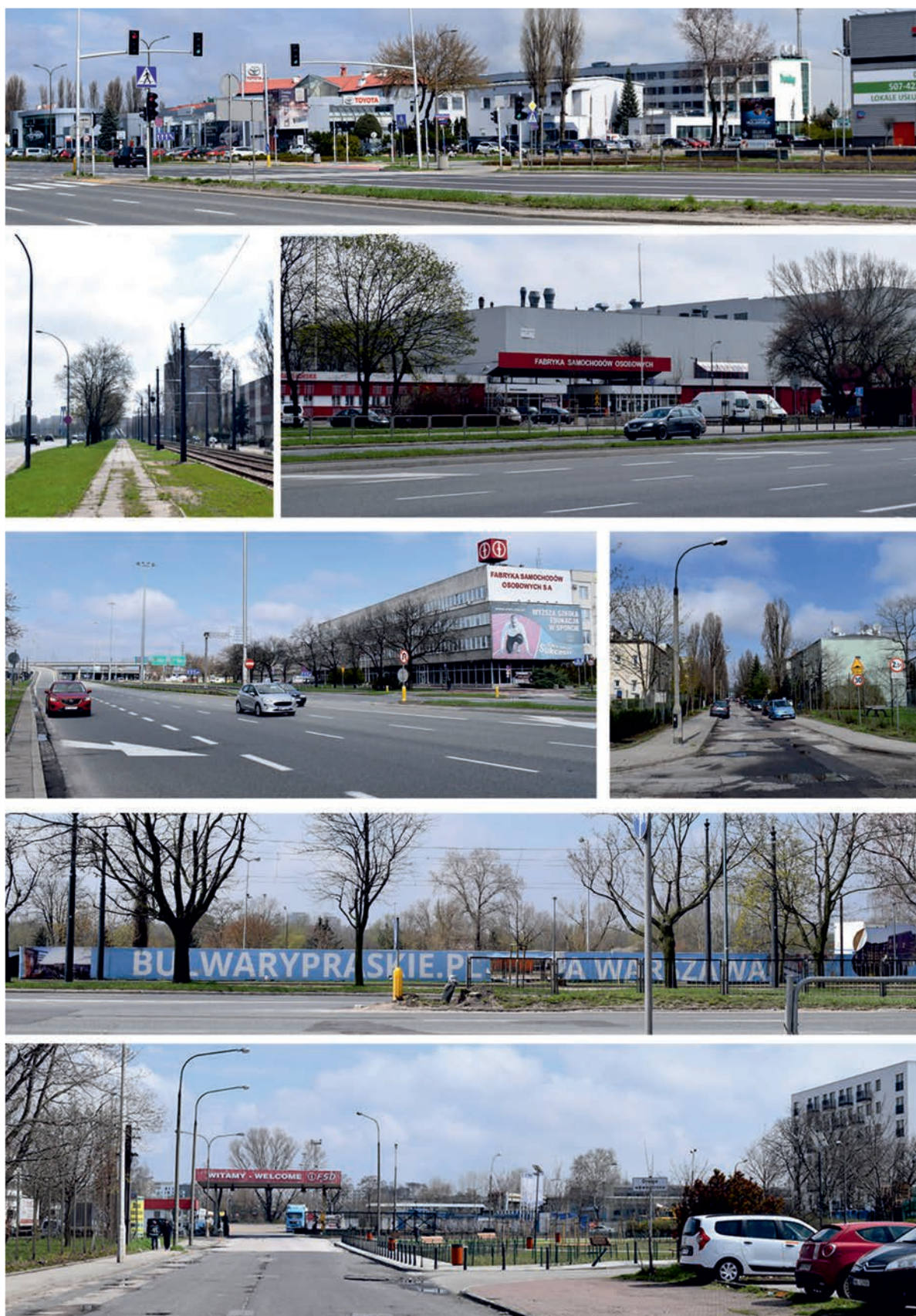
Fot. 4. Okolice ulicy Jagiellońskiej, wjazdu na most gen. S. Grota-Roweckiego, d. Fabryki Samochodów Osobowych oraz osiedla Śliwice. Photo 4. The vicinity of Jagiellońska Street, the entrance to the Gen. S. Grota-Roweckiego bridge, former Motor Car Factory and the Śliwice estate.