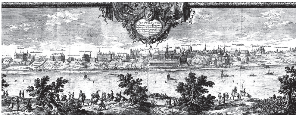
III. 1. The panoramic view of Warsaw, Eric Dahlberg, 1656, reprint in author's collection

II. 1. Panorama Warszawy, Eric Dahlberg, 1656, reprint w zbiorach autorki