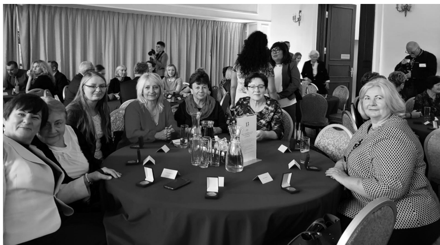
Fot. 4. Wyróżnieni pracownicy Bloku Operacyjnego.