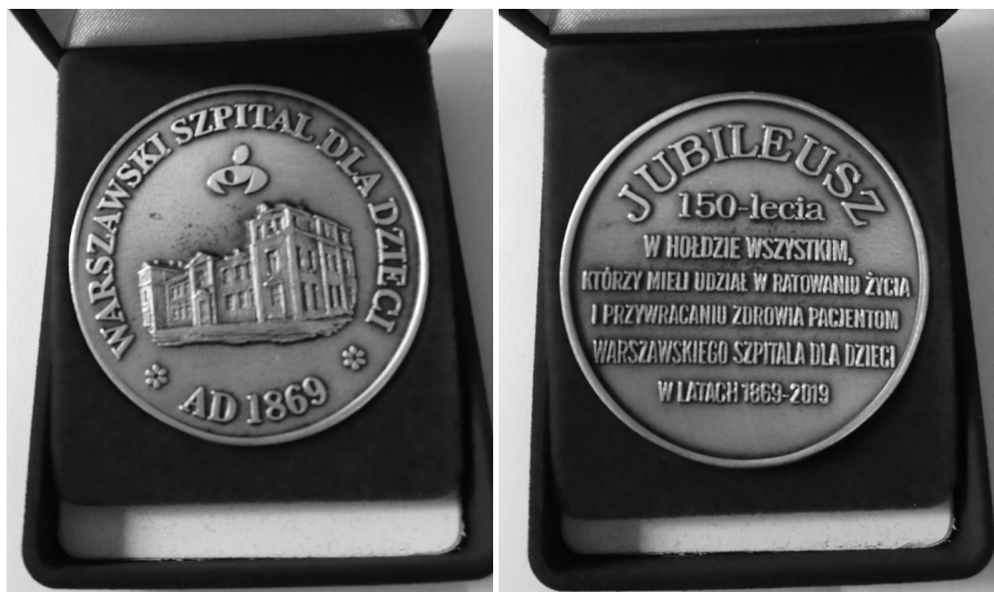
Fot. 2. Medal okolicznościowy.

W ramach obchodów 150-lecia istnienia placówki przeprowadzono też akcje promujące zachowania prozdrowotne. 27 czerwca rozpoczęła się akcja „150 litrów krwi na 150-lecie Warszawskiego Szpitala dla Dzieci”, w ramach której pracownicy postanowili podarować potrzebującym pacjentom 150 litrów krwi. Natomiast z okazji obchodzonego 15 października Światowego Dnia Mycia Rąk na fasadzie budynku przygotowano okolicznościową iluminację, a w internecie i na monitorach w Tramwajach Warszawskich można było obejrzeć spot promujący higienę rąk. Pracownicy szpitala przekonywali również mieszkańców w centrum Warszawy do badań mikrobiologicznych rąk.