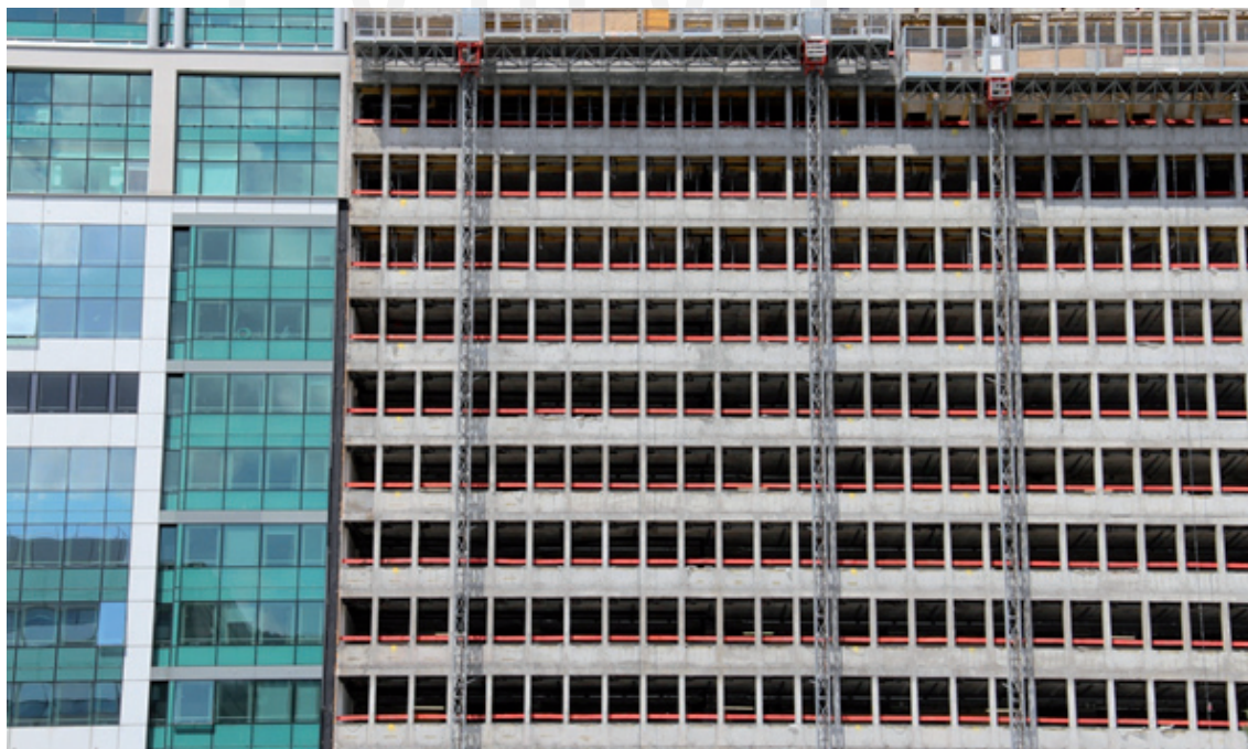
III. 6. Modernization of office objects in the complex of Maine Montparnasse – May 2012