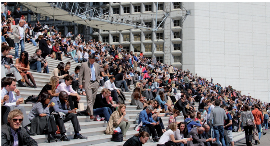
III. 5. Lunch break in La Défense – May 2012