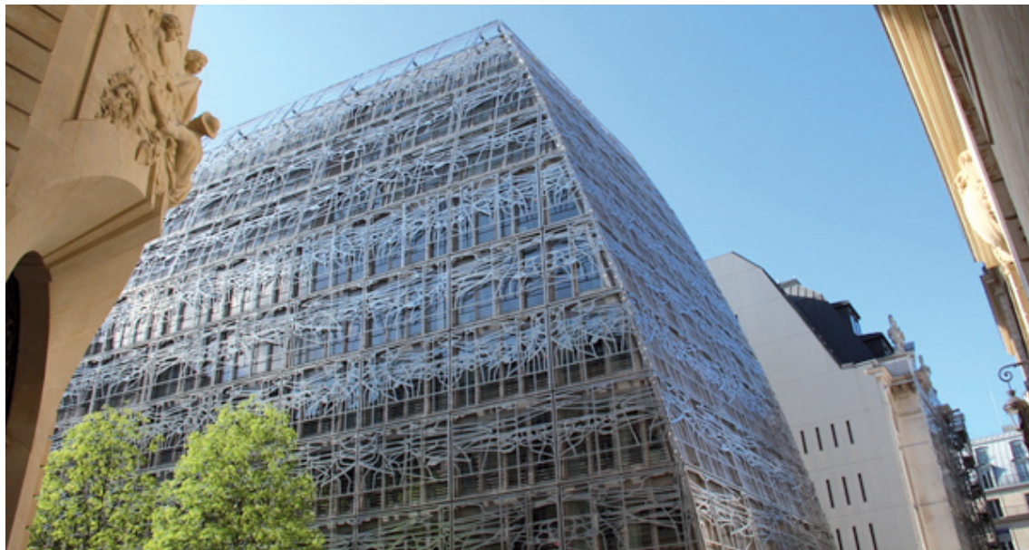
III. 8. New wing of the building of the French Ministry of Culture in Paris implemented in 2005. Architect Francis Soler