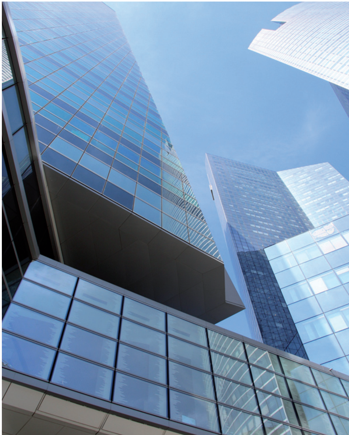
Ill. 7. Towers of La Défense – May 2012