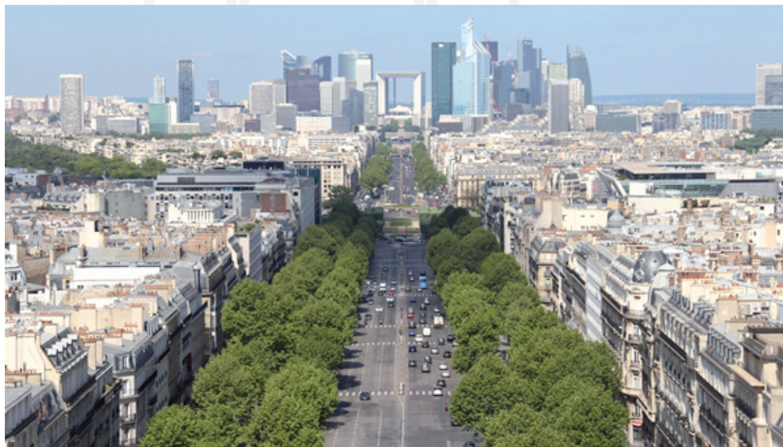
III. 2. View of the district of La Défense from the centre of Paris – May 2012