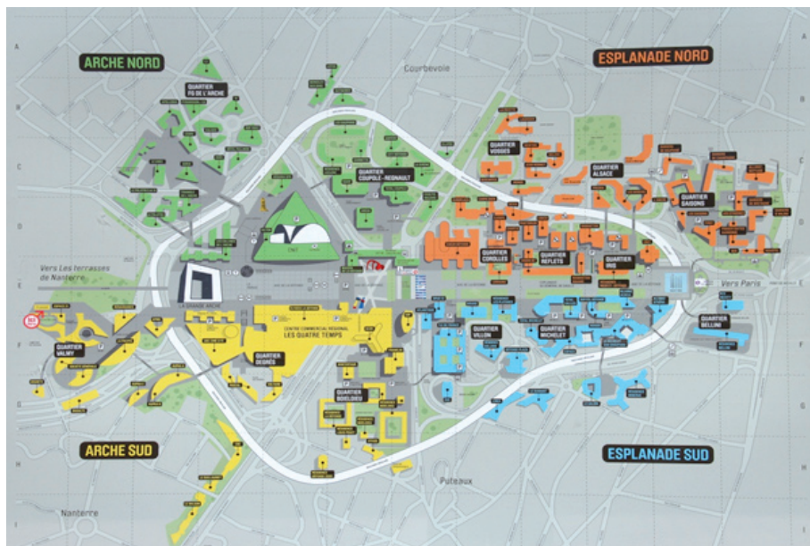
III. 3. Development of La Défense and the neighbouring areas – May 2012

II. 3. Zagospodarowanie la Défense i podłączonych do niej przyległych tertenów – maj 2012