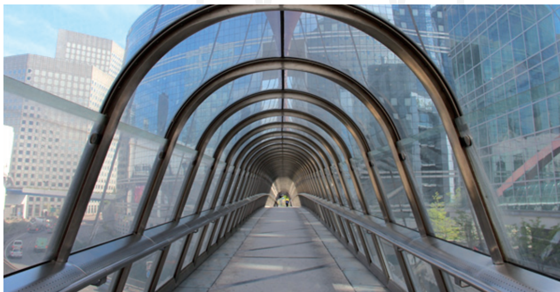
III. 4. Footbridge connecting the area of La Défense with office objects raised outside its area – May 2012

II. 3. Zagospodarowanie la Défense i podłączonych do niej przyległych tertenów – maj 2012