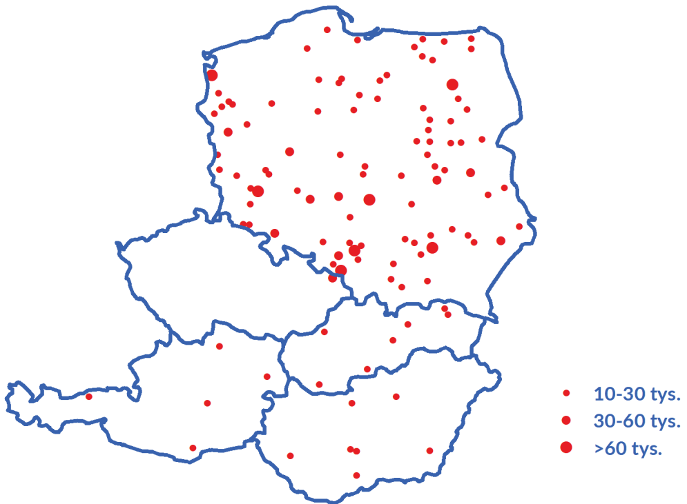
Il. 3. Miasta powyżej 10 tys. mieszkańców bez dostępu do kolejowych przewozów pasażerskich w Polsce i pozostałych państwach regionu (źródło: opracowanie własne na podstawie Centrum Zrównoważonego Transportu, http://www.czt.org.pl ; dostęp: 25.03.2018)